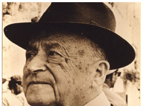
שי עגנון

הסיפור 'עד עולם' של ש"י עגנון נכלל בספר "האש והעצים", שיצא לאור ב-1954. זה הספר האחרון שפירסם עגנון בחייו. 'עד עולם' הוא סיפור מיסטורי הכתוב בכתב-צופן, שעד היום לא פוענח. במאמר זה ננסה למצוא את הפתרון