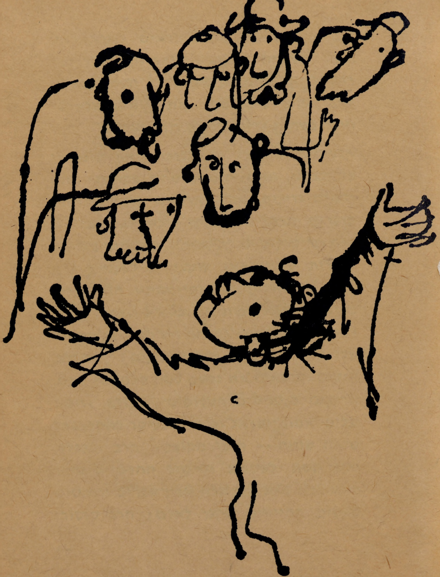
מתוך "ספריהם של צדיקים"