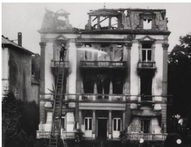
למחרת השריפה. צולם ביום ה' (5.6.1924), ג' בסיוון תרפ"ד.

שמו של הבית, שהתנוסס לגובה 4 קומות ברחוב הקיסר פרידריך, היה ה"וילה אימפריאל" על שם הנסיך מוויילס, לימים אדוארד השביעי מלך אנגליה, שנהג לשכור את הבית לחודשים שלימים כשהגיע לבלות בספא שבעיר הנופש באד הומבורג. הבית ממוקם ליד גן ציבורי גדול "קורפארק" וניתן למצוא בו גם היום שביל על שם עגנון ואנדרטה להנצחת תקופת שהייתו של הסופר בעיר.