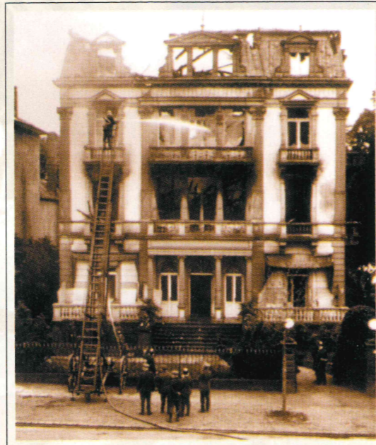
1924, הבית בבאד הומבורג בעת כיבו השריפה

בשיא פריחתו, כבעל משפחה נאה, הכנסה בטוחה וקריירה מבטיחה התיישב עגנון בעיר באד הומבורג, והנה בן לילה בא עליו אסון כבד. אור ליום ד' בסיוון תרפ"ד בליל ה-5 ביוני 1924,