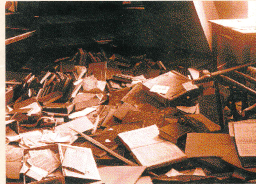
ביתו של עגנון בתלפיות, פרעות אב תרפ"ט