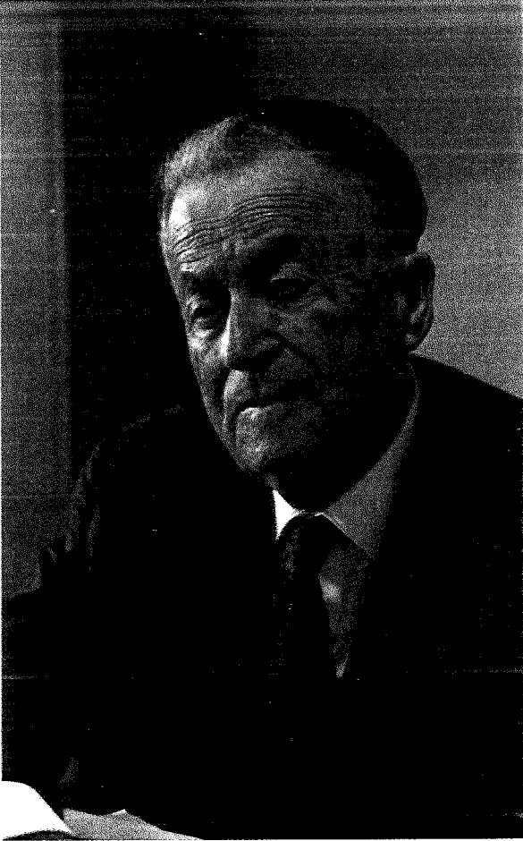
ש"י עגנון 1966

"בעוד תהיה נשמת אלוה ביי": הפיוט, שנחתם בהכרזה דרמטית שיש בה כעין שבועה או השבעה, מרמז גם על מקומו, לפני "נשמת כל חי" שבתפילה.