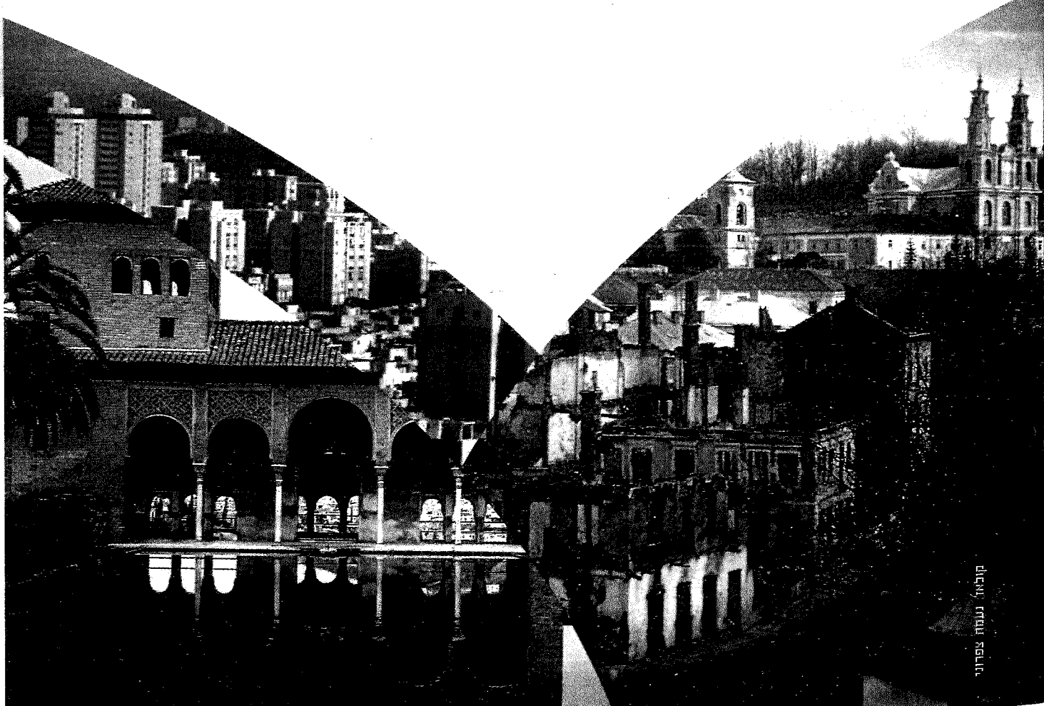
קובץ נעמה צפוני

עגנון משנן את שיר הזיכרון הנפלא, אך כשהוא ניגוד מהפגישה השיר נמחק, ואין הוא מסוגל לזכרו. "סמרה שערות בשירי ונמס לבי ונתבטלתי ממציאתי והייתי כאילו איני. ואילולי זכר השיר הייתי ככל בני עירי אשר אברו ואשר מתו ביד עם נבל ומנואץ אשר ניאצו את עמי מהיות עוד גוי. אך מחמת גבורת