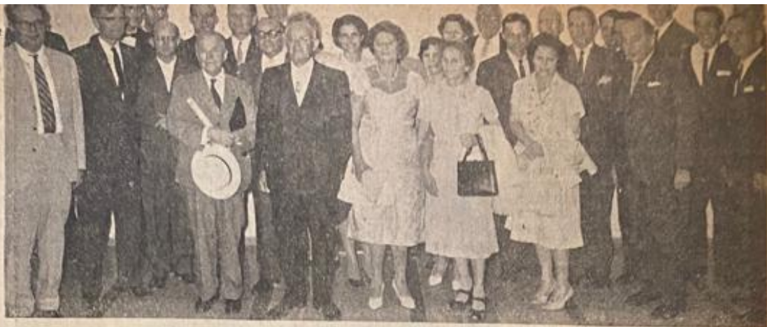
הכרה בעולם מאשיית היבית בשנת קבלת פרס נובל, עם בני משפחה, חברים ושותפים לדרך. בצילום: פרס נובל לשנת 1987, משה ונדר בנימין, עם תרגום ויצוריות ללוטיות. בצילום: עננו ורעיונו יחד עם קבוצה של מרופסורים מאשיית היבית בשנת קבלת פרס נובל, עם בני משפחה, חברים ושותפים לדרך. מר ישראל נימון.