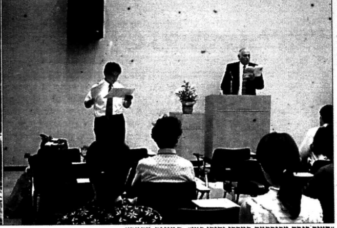
"הקויר קובה מפורסמת במרכז יהודי קטן" תמונות מהמסע.

כל זמן שרבי אוראל היה חי, היתה רצועה של ארץ ישראל נמשכת והולכת לכיתו, כיוון שנפטר לא היה לו רבי יחידה מגדולי כל חצולם כדאי, עד שנתן המקום בלבו לעלות לארץ ישראל (אלו אלו), בלבב ימים, 1934 עמוד 490). כדי לקיים את הרצועה שנפ" סקה יש ללכת אל הממש. גם קדושתו של ר' יהודה גר בוד הכנסת כלה, לאחר שהשיא את בנותיו, נשאבת מארץ ישראל שהיתה לל מעיניו. אילו לא היה עולה ר' יהודה בעצמו לארץ ישראל, היה כל סיפור הגנס פוקע. כך גם סיפור העלייה בתמול שלשום: "הלילה הזה עבר ומחלחל הרכבת נראה פתאום למין רצועה אנשים שהיו עם יצחק בקרוב כמו ממוקמים וקראו מתוך שמחה, זה היה, זה היה, זה ימנו. יצחק עקד ונתחבל בימי זה היה שהוא סניף לימה של ארץ ישראל." (תמול של