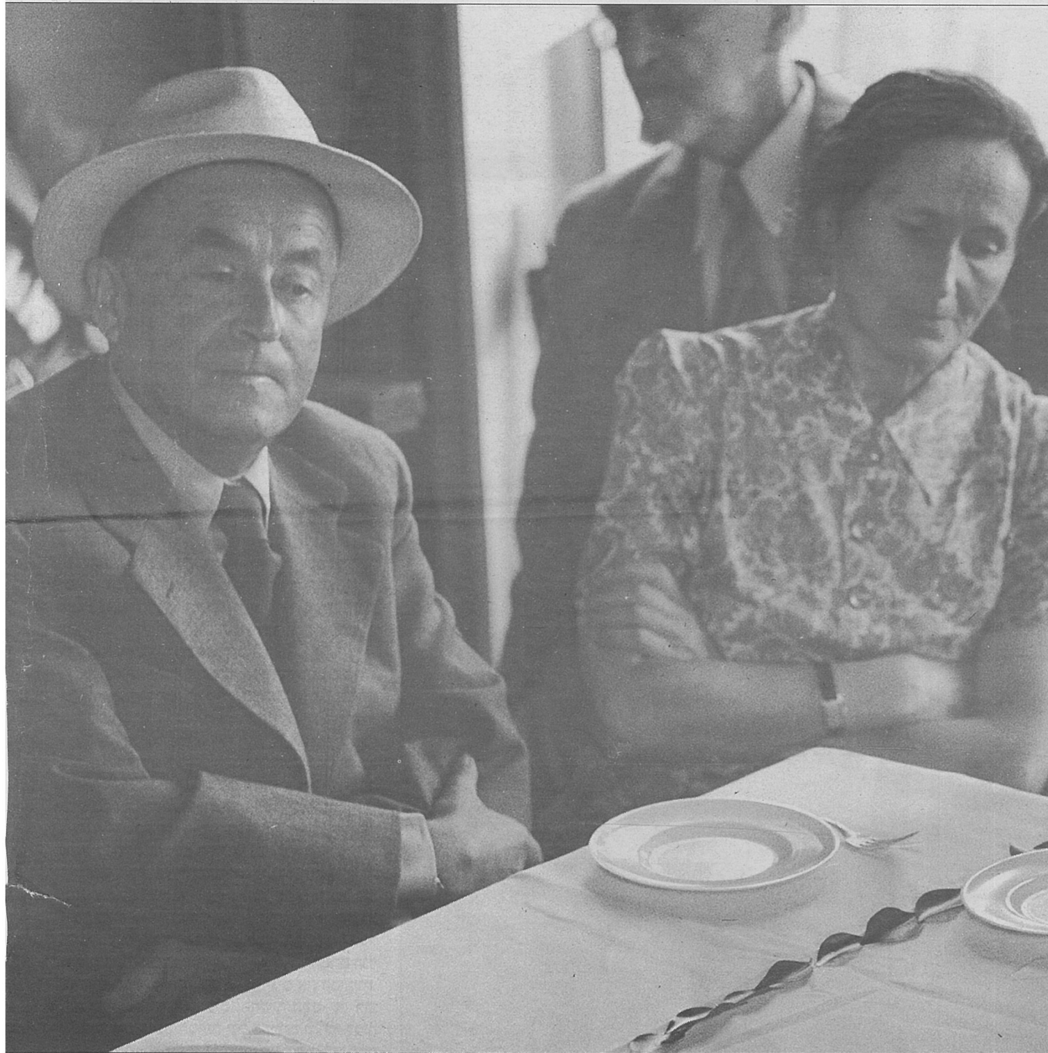
ש"י עגנון באירועים לכבוד זכייתו בפרס נובל לספרות (1966). כיום קשה מאוד ליהודים אנינים לקרוא שורות המדיפות ניהוח "גזעני" כל כך, אבל אין יצירות עגנון ואין יהדות ללא חברת יתרון הערך ומשמעות הסבל וסיבתו

'אור תורה' נדפס לראשונה ב'המצפה' ב-1906, והוא אחד משלושה סיפורים שנדפסו יחד תחת הכותרת הכללית 'פיליטון' וכותרת המשנה 'טיפוסים'. 'אור תורה' הוא הסיפור השני, המופיע לאחר 'בעל הבית' ולפני 'הפנח השבורה', שזכה לשני גלגולים ידועים – 'חלומו של יעקב נחום', ולפיתוח משמעותי ביותר ב'יתום ואלמנה'. ב'בעל הבית' נסובה העלילה על שני שותפים בבית אחד. גם ב'אור התורה' יש מבנה דו קומתי: בית, הוא ביתו של הגביר הלמדן אשר ברוך, ועלייה. 'הבית והעלייה' הוא צירוף תלמודי הלכת המהווה כאן מטפורה סמויה של נגלה ונסתר, נמוך וגבוה, עולם תחתון ועולם עליון, וגם סתירה נפשית-פנימית בדמות הגביר ובישות המסיפר המובלע.