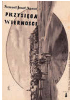
Szmuel Josef Agnon Przysięga wierności tłum. Piotr Paziński Nisza

– Można odczytywać ją jako rzecz właśnie o agunach: dawnym przyrzeczeniu, które wciąż wiąże przynajmniej jedną ze stron – mówi Piotr Paziński. – Stąd wplecione w tekst obrazy z „Księgi Rodzaju” i „Pieśni nad pieśniami”.